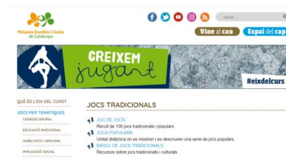
Recursos sobre jocs tradicionals dels Minyons Escoltes i Guies de Catalunya