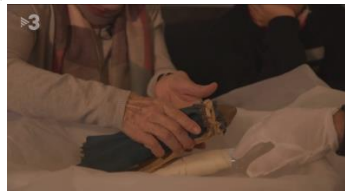
La història de la nina de pedra del museu

A internet (per accedir al recurs cliqueu a la imatge)