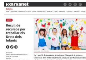
Propostes i recursos per treballar els drets dels infants