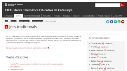
Recull de jocs tradicionals (XTEC)