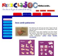
Com construir i jugar amb patacons